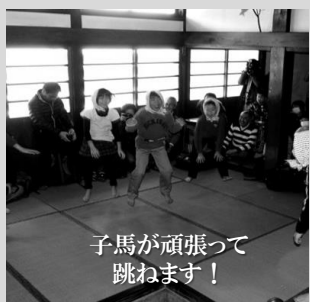
子馬が頑張って 跳ねます！