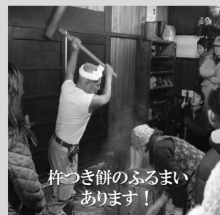
杵つき餅のふるまい あります！