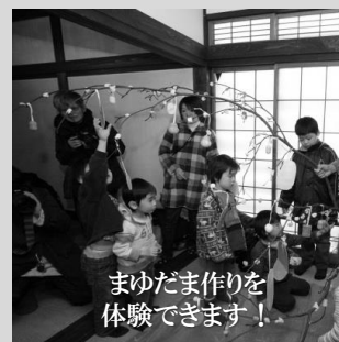
まゆたま作りを 体験できます！