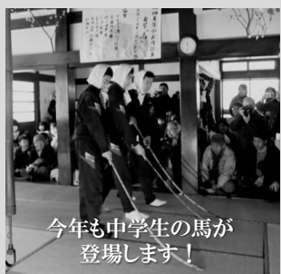
今年も中学生の馬が 登場します！